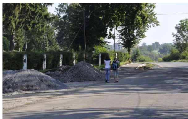
Výstavba chodníka do cintorína