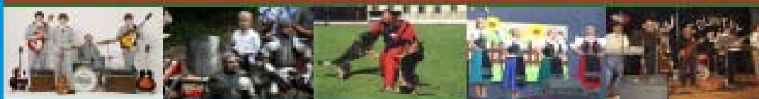
Tlač: Novosti mestské spravuje na ústredí foto: Lučenec