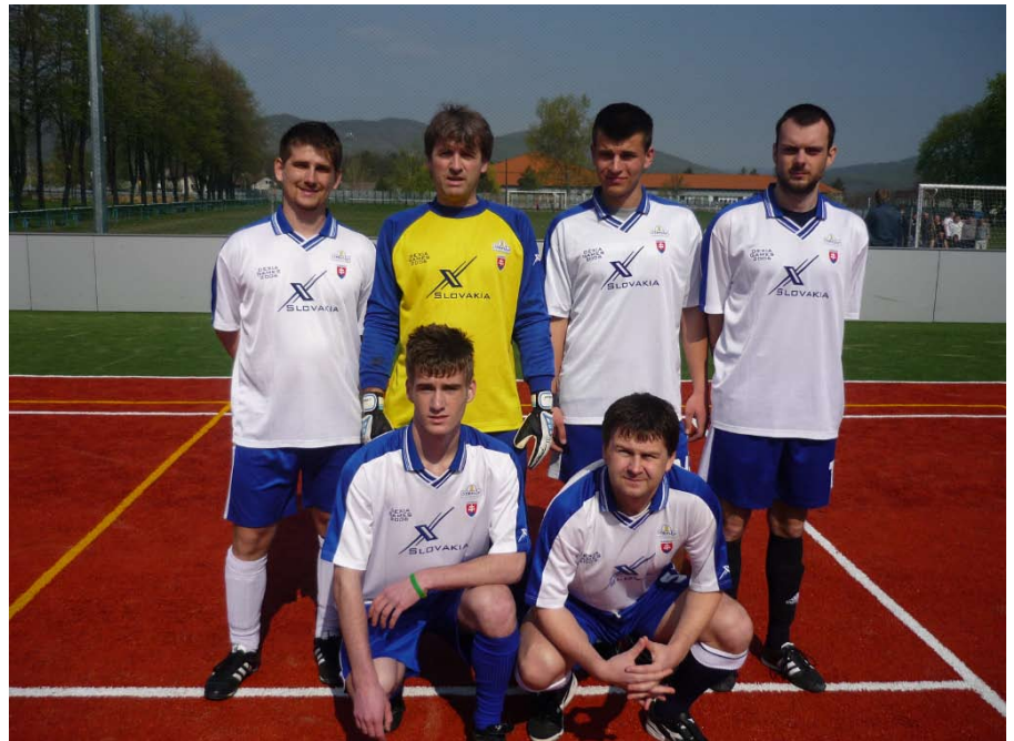
Víťazi turnaja v malom futbale

zúčastnili sa len 4 družstvá. Neprišli hráči z Tomášoviec a nenazbierali sa ani domáci hráči. Súťažili teda družstvá Data – team Žilina, Veľká Ves, Láza, Lehôtka. Hralo sa systémom každý s každým 2 x 15 minút. Družstvá skončili v poradí ako boli vymenované.